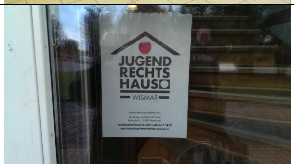
Jugendrechtshaus Wismar Abteilung Neukloster